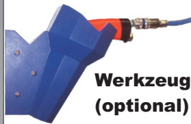
Werkzeugköcher "OTTO I" (optional)

Auch als Variante mit Elektrokabel erhältlich!